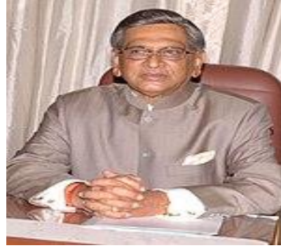
एस. एम. कृष्णा