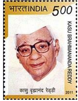
कासू ब्रह्मानंद रेड्डी