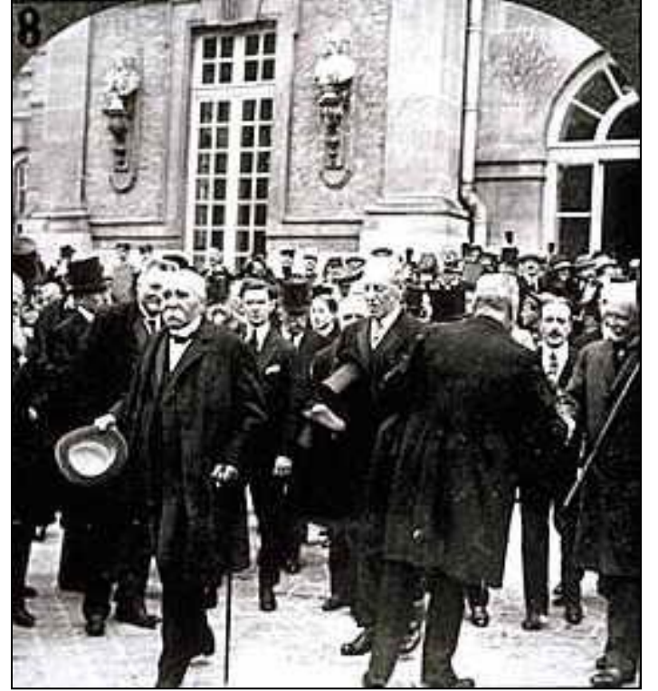
Georges Clemenceau (France), Lloyd George (Britain), and Woodrow Wilson (US) at Versailles